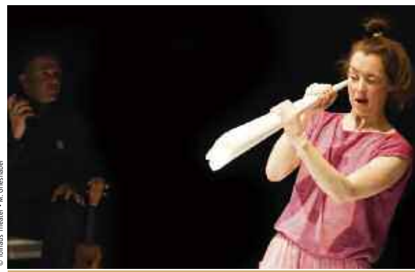
© Tobias Theater - M. Grieshaber